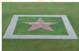
Elvis Stern 25x25 m

Unter dem Schirm der Senioren führt dieser Erste Deutsche Senioren-Freizeitpark die Generationen zusammen.