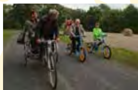
Rikscha und Schaukelrad